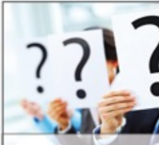
PLATZHALTER Was Sie noch wissen sollten.