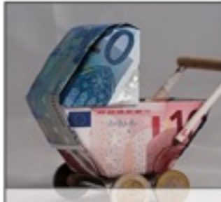
ELTERNGELD ELTERNZEIT Alles, was Sie wissen müssen.