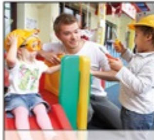
KINDERBETREUUNG Erfahren Sie hier mehr über unsere Betreuungsmodelle.