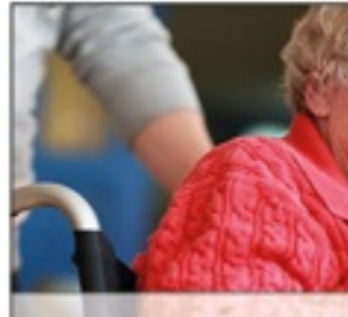
PFLEGE Was Sie wissen sollten und wie wir Sie unterstützen.