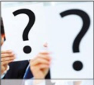
PLATZHALTER Was Sie noch wissen sollten.