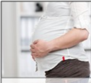
SCHWANGERSCHAFT MUTTERSCHUTZ Das sollten Sie beachten.