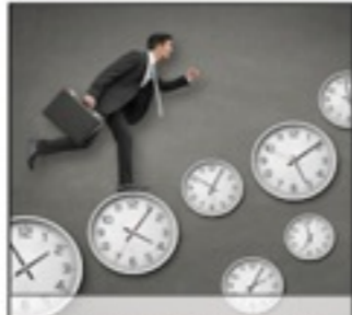
ARBEITS(ZEIT)MODELLE Wir bieten Ihnen zahlreiche flexible Arbeitszeitmodelle.